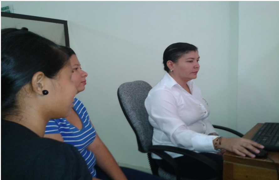
Asesoría de Investigación a integrantes del Grupo ATIS