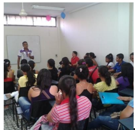
Foto: tomada el día Jueves 30 de Mayo en las instalaciones de Corposucre

Cabe resaltar, que el interés que se ha generado en los estudiantes, es debido al alto compromiso por parte del cuerpo docente y los diversos directivos, que son los encargados de esparcir semillas de conocimientos a futuros profesionales y de formar personas idóneas, promotores de cambios y mejoramiento para el entorno donde se desarrollan. De igual forma, las instalaciones de la corporación, ofrece los recursos físicos y tecnológicos que contribuyen al proceso de enseñanza – aprendizaje, requeridos y necesarios para un adecuado ejercicio académico y por ende a una mejor asimilación del conocimiento por parte del alumnado.